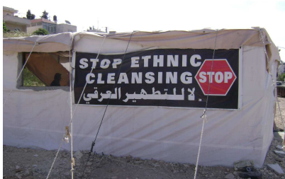
Protesttent in Sheikh Jarrah

De katalysatoren van dit project zijn met recht en rede de kolonisten te noemen. Zij zitten zo nauw verweven in het netwerk van de Israëlische overheid, waardoor men zich kan afvragen of men wel van twee aparte