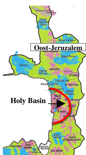
Oost-Jeruzalem en de 'Holy Basin'.

De staat Israël heeft een aantal reddingsplannen voor handen om een opdeling van Jeruzalem onmogelijk te maken. Welk plan de finish haalt en hoe ver Israël kan gaan in het realiseren van de 'Greater Jerusalem'-droom is afhankelijk van de buitenlandse druk. Ondanks de verschillende scenario's voor Jeruzalem blijft de kern van het Israëlische beleid in het geannexeerde Oost-Jeruzalem sinds 1967 ongewijzigd: zoveel mogelijk grond met zo weinig mogelijk Palestijnen. Wegens de verhoogde druk op een tweestatenoplossing voert de Israëlische staat op dit moment een koers van 'damage control' en 'worst case scenarios' en tracht ze te redden wat te redden valt. De realiteit op het terrein maakt duidelijk waar de grootste spanningsvelden zich situeren.